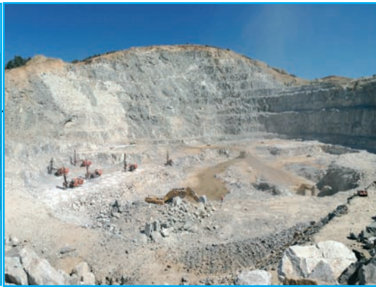
Vista panorámica de una de las cortas de la mina Los Santos-Fuenterroble.