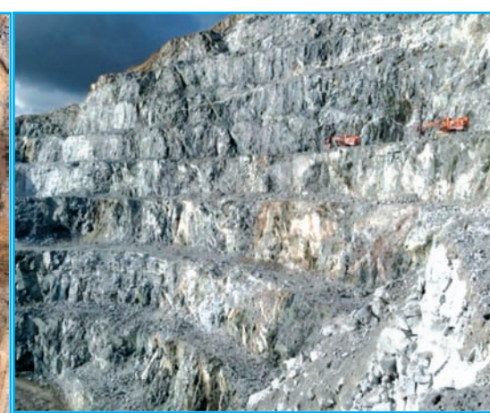
■ Parte de un talud de una de las cortas.

La empresa Movitex es el actual operador minero que realiza la extracción de los distintos materiales en Mina Los Santos-Fuenterroble . El papel de la compañía es fundamental a la hora de llevar a cabo con éxito la selección del mineral. Una mala ejecución de las voladuras daría lugar a la mezcla de los estériles con el mineral y es por esto que junto con los técnicos de Daytal, Movitex planifica de forma muy escrupulosa un plan de voladuras semanal, buscando la forma de llevar a cabo las distintas voladuras de producción sin que exista pérdida o dilución del mineral. Para esto las voladuras de producción se realizan con una profundidad de cinco metros, delimitando la zona mineralizada a través de voladuras de contorno, e intentando por todos los medios que a la