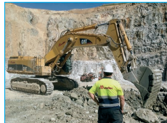
■ Maquinaria de excavación y carga utilizada por Movitex en la corta.

A la vez, una buena calidad en la perforación y voladura es fundamental para mantener el buen estado de los taludes. La altura de banco de diez metros y la berma de cuatro metros, se consigue mediante la realización de la técnica de precorte. Movitex en este aspec-