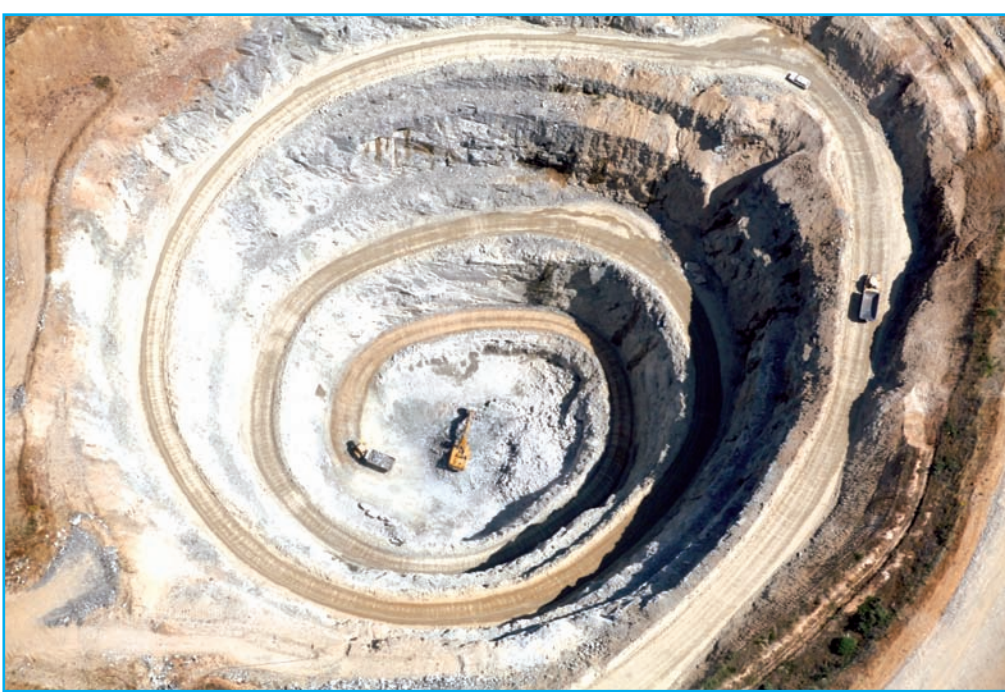
■ Vista aérea de una de las cortas en Mina Los Santos-Fenterroble.

para compaginar la extracción de estéril y mineral de forma que siempre exista mineral disponible tanto en alta y baja ley en alguna corta, mientras se está extrayendo estéril en otras.