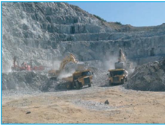
Carga de los dúmperes del material extraído para su traslado a la planta de tratamiento.