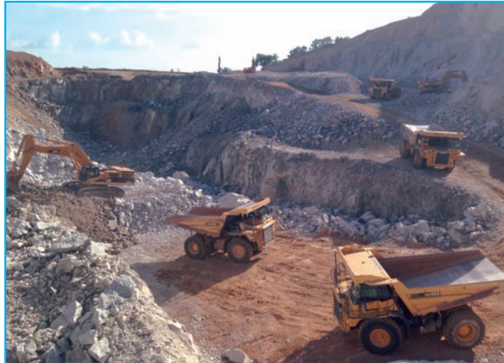
Distinta maquinaria de Movitex en una de las cortas. La demanda de mineral por la planta de tratamiento obliga a una tarea constante de carga y transporte

Otro factor a tener en cuenta de la explotación, es la alta dureza y abrasividad del material, llegando a provocar desgastes en la maquinaria casi rozando lo increíble. Para tener una referencia de esto, la frecuencia con que se cambian las bocas de perforación pueden llegar a ser de unas siete horas de trabajo, o la