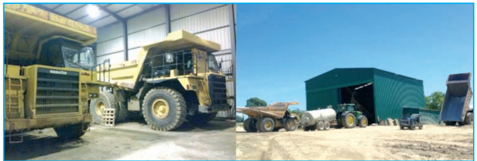
Talleres de Movitex en la mina Los Santos-Fuenterroble.

cantidad de tiempo en que se cambian los dientes de la retroexcavadora no sobrepasa las treinta horas.