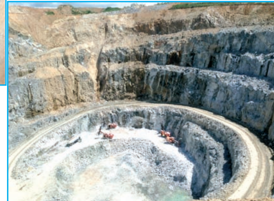
■ Perforación de voladura de producción.

hora de realizar la voladura de mineral, en esta se produzca la máxima trituración con el mínimo desplazamiento.