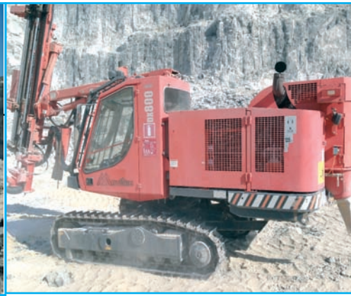
Perforadora de martillo en cabeza de Movitex.

to es muy cuidadoso a la hora de perforar, intentando por todos los medios que se produzca un mínimo desvío de barrenos y estudiando muy bien la distancia de la fila de apoyo al precorte en cada situación, con el fin de que no se descabece la berma o se produzcan daños al talud. Es importante para evitar esto estudiar en cada zona y situación la proporción entre explosivo tipo Anfo y el explosivo gelatinoso, estudio que el equipo de ingenieros de Movitex ha venido haciendo, al objeto de mejorar notablemente la estabilidad de los taludes.