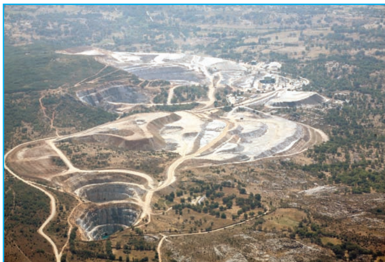
Vista aérea de la mina Los Santos-Fuenterroble.

En conjunto, Daytal y Adam Wheeler , estudian los resultados de los sondeos, diseñando las futuras cortas y realizando una planificación minuciosa, contemplando entre otros factores, el coordinar los trabajos en las distintas cortas